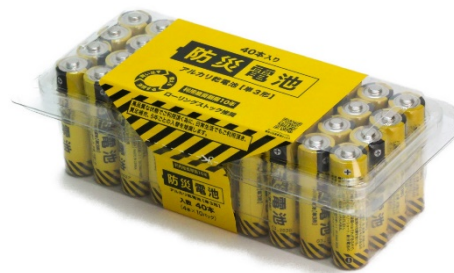
単三形乾電池 40本入り